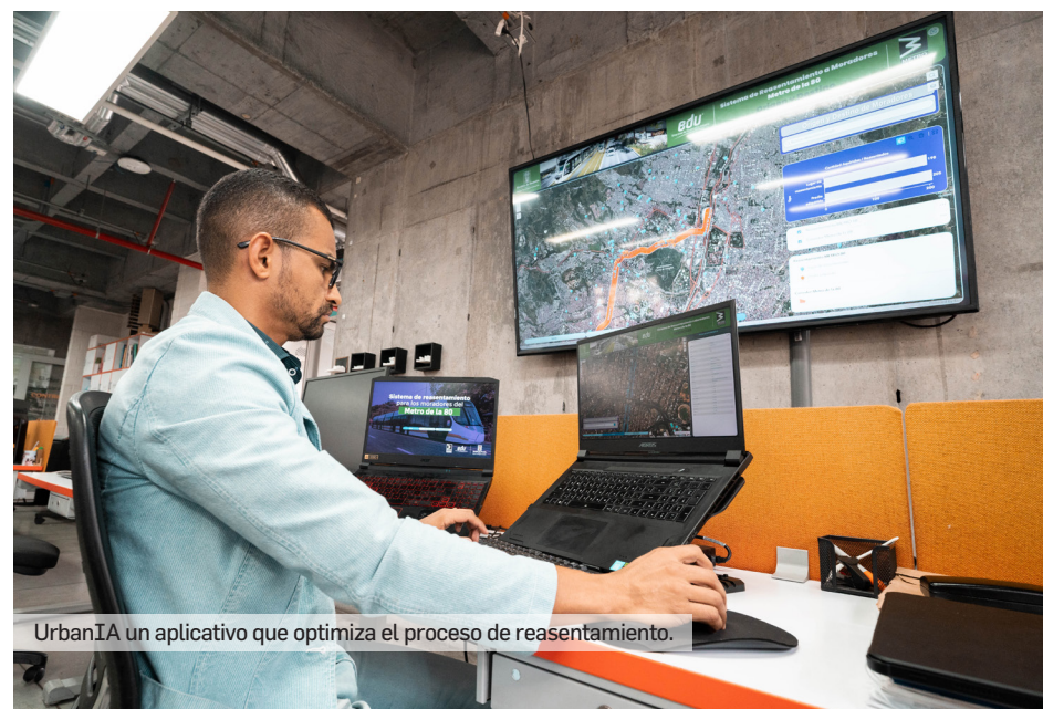
UrbanIA un aplicativo que optimiza el proceso de reasentamiento.

Para hacer seguimiento y avanzar en la gestión sociopredial del proyecto, actualmente implementamos un aplicativo innovador llamado UrbanIA: un ecosistema digital para el desarrollo territorial que permite integrar, analizar y gestionar en tiempo real información clave para la toma de decisiones y la formulación de soluciones.