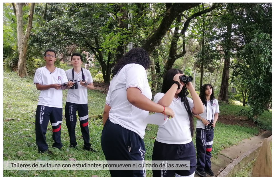
Talleres de avifauna con estudiantes promueven el cuidado de las aves.

Estos talleres permitieron no solo identificar diversas especies, sino también sensibilizar a los estudiantes sobre el valor de la avifauna urbana, fomentando una actitud de cuidado y conservación que contribuye a la protección del ecosistema local desde el proyecto Metro de la 80.