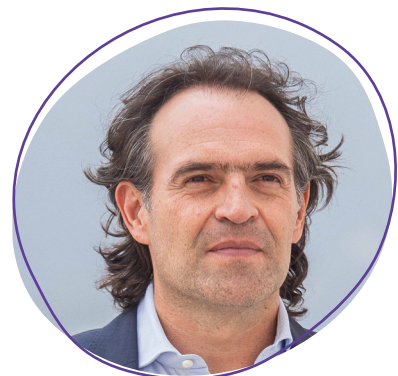
Federico Gutiérrez Zuluaga Alcalde de Medellín