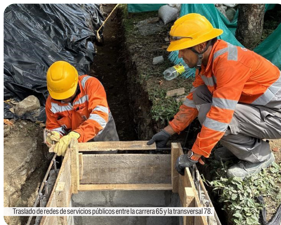
Traslado de redes de servicios públicos entre la carrera 65 y la transversal 78.

En el sector Caribe, las obras continúan avanzando en una etapa fundamental que, aunque se desarrolla bajo tierra, será determinante para dar paso a una nueva infraestructura elevada. Entre la carrera 65 y la transversal 78, en inmediaciones de la parada Cementerio Universal de la Línea O, avanzan las intervenciones para el traslado de redes de servicios públicos, actividades indispensables para preparar el terreno donde se construirá el futuro viaducto del Metro de la 80.