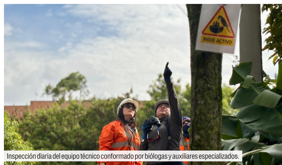
Inspección diaria del equipo técnico conformado por biólogas y auxiliares especializados.

En el Metro de la 80, cada obra también avanza con acciones concretas para proteger la biodiversidad urbana.