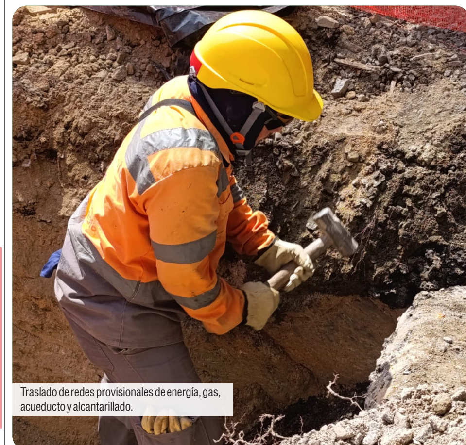
Traslado de redes provisionales de energía, gas, acueducto y alcantarillado.