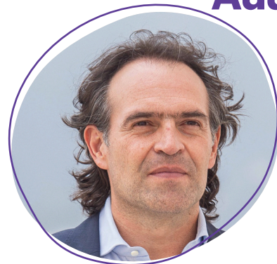
Federico Gutiérrez Zuluaga Alcalde de Medellín

El Metro de la 80 es un proyecto de movilidad sostenible que nos soñamos hace muchos años en Medellín. Ha sido un camino largo que hemos recorrido unidos, por medio de un trabajo conjunto entre la alcaldía y esta empresa de transporte de la que nos sentimos tan orgullosos, que es un ejemplo para Colombia. Con todos los sistemas que tenemos en la ciudad mejoramos la calidad de vida de la gente, transformamos los barrios, ayudamos a que los desplazamientos sean más ágiles y fáciles para todos los ciudadanos.